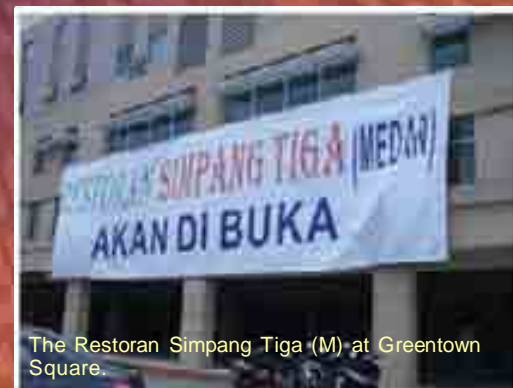
The Restoran Simpang Tiga (M) at Greentown Square.

The Simpang Tiga Restaurant in Ipoh will be located at the Greentown Business Square with a seating capacity for 300 patrons at any one time.