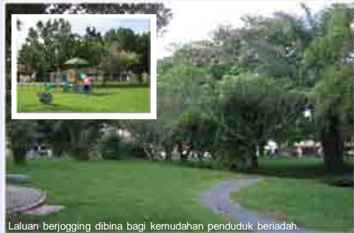
Laluan berjogging dibina bagi kemudahan penduduk beriadah.

A few residents when met said they took care of the garden as if it's their own by doing all the chores such as cleaning, weeding and planting various species of