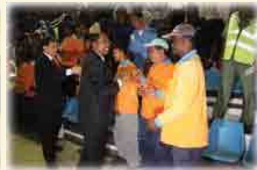
YAB Dato' Seri Dr. Zambry beramah mesra dengan kakitangan MBI.