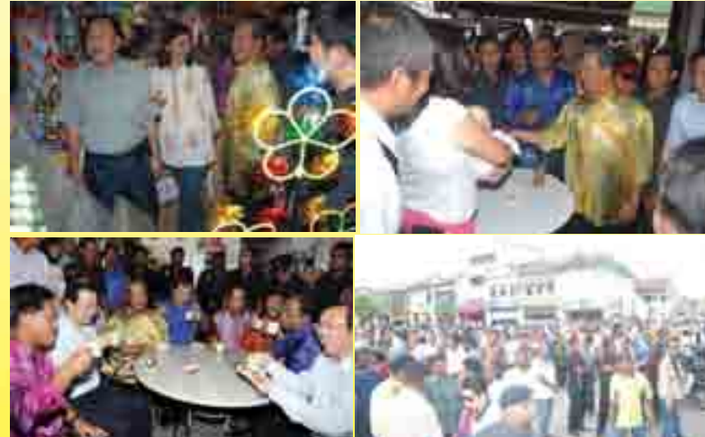
TPM YAB Tan Sri Muhyiddin Yassin meninjau dan beramah mesra dengan peniaga di Little India.

The construction of the arch and the painting of the buildings will start simultaneously.