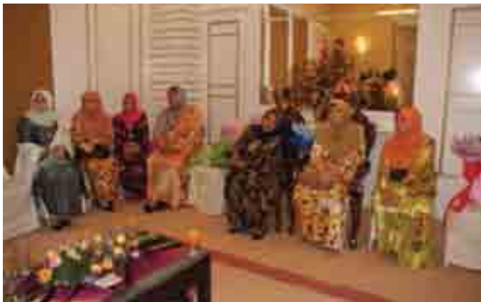
Isteri-isteri mantan-mantan Datuk Bandar Ipoh yang turut hadir pada jamuan itu.